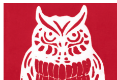
325 ★★★★★ □●