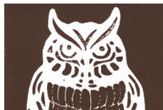
630 ★★★★★ ■