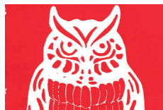
320 ★★★★★ ▣