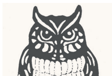
100 ★★★★★ ■●