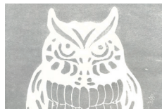
810 ★★★★★ ▣