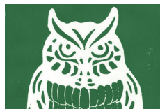
530 ★★★★★ ■