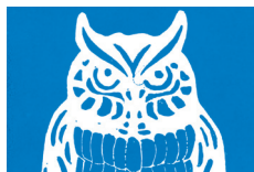
440 ★★★★★ ■●