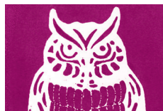
330 ★★★★★ ▣●