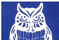
430 ★★★★★ □●