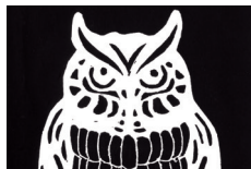
735 ★★★★★ ■●