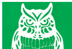
520 ★★★★★ ■