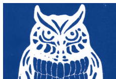
435 ★★★★★ ■